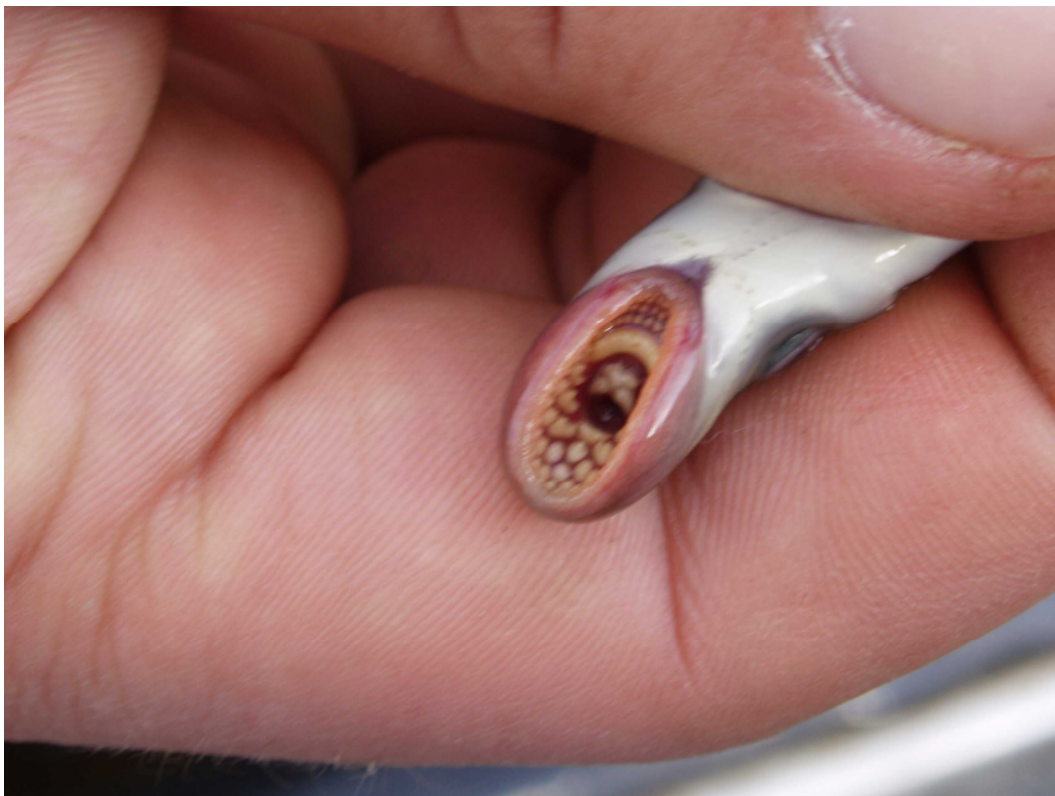
Saugmund: auf der Saugscheibe des Meerneunauges sind zahlreiche Zähne in konzentrischen Bogenreihen angeordnet