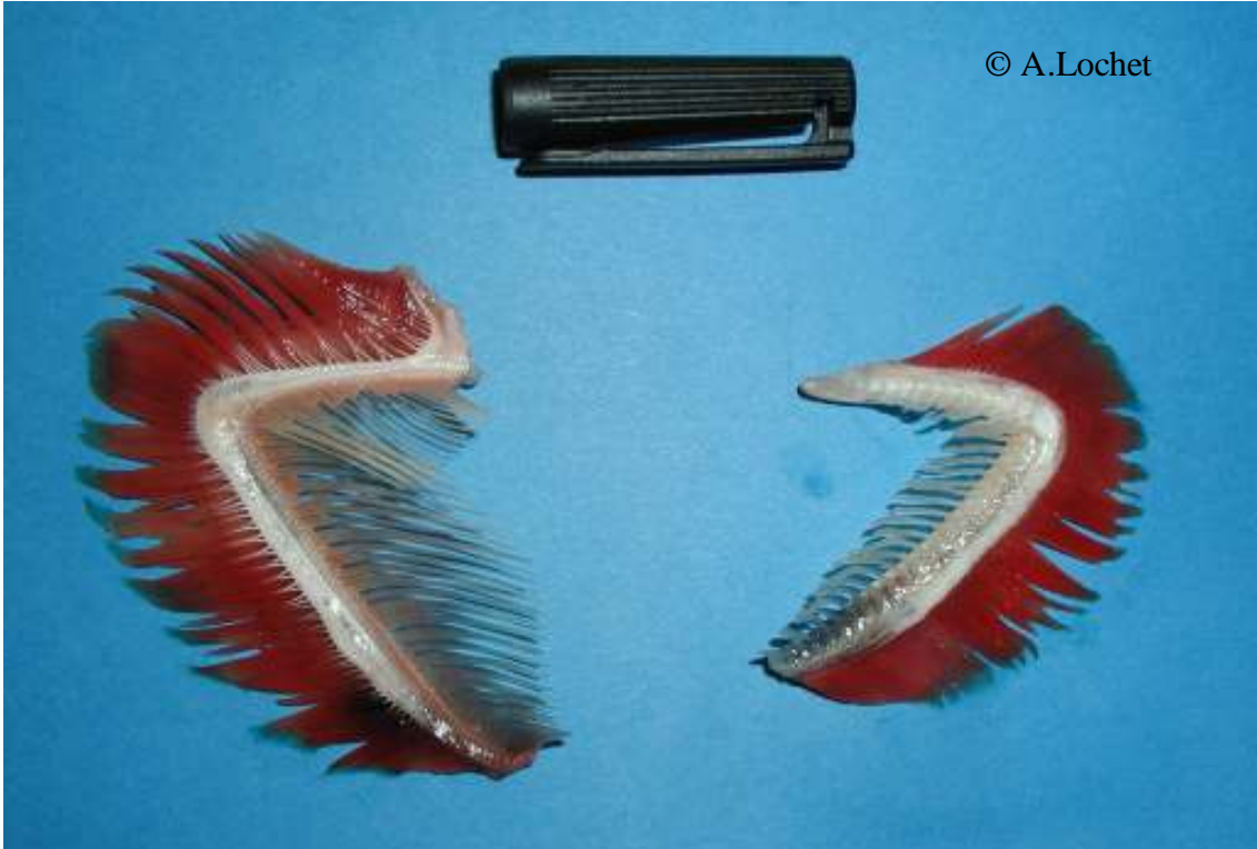
Maifisch (Alosa alosa) 90 bis 130 Kiemenreusendornen